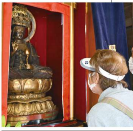
ご開帳となった正観音菩薩坐像

越谷市増林の林泉寺(木村惠隆住職)で4月21日、鎌倉時代後期の嘉元2年(1304年)の作とされる県指定有形文化財「正観音菩薩坐像」の修復後初のご開帳が行われた。ご開帳は毎年4月、観音様の日である18日に近い日曜に行われる。ご開帳前に一升餅を供え、ご開帳後、餅の上の部分だけを持ち帰り、無病息災を願うとされる。同坐像の修復は82年ぶりの3度目。約1年をかけて解体修復された。座高84センチ、ヒノキ材の寄木造りで、肉身には金泥が塗られ、衣には朱彩が施されている。参拝者たちは、優しい面立ちに「きれいですね」と話していた。