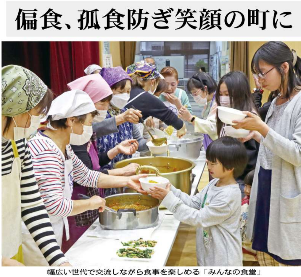
幅広い世代で交流しながら食事を楽しめる「みんなの食堂」

この日はホールに机といすが並べられ、約50人の親子がカレーや副菜の「小松菜と夏みかんは草加市産。地元農家の協力で実現菜とベーコンのソテー」。